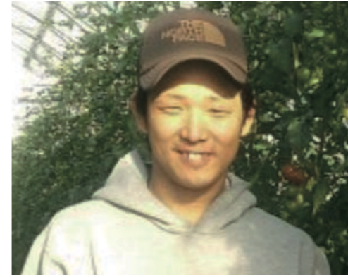
有限会社岡山県農商(岡山県岡山市) 代表取締役