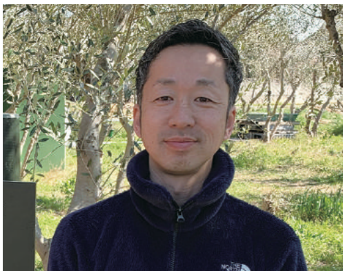
埼玉福興株式会社(埼玉県熊谷市) 代表取締役

農業には多様な作業工程があり、工程を細分化し分業化することにより、障害のある方や高齢者等の活躍の場を創出することが可能となります。また、農作業環境や農作業・園芸活動には、ストレス軽減、心身機能の賦活など健康増進に繋がる特徴があり、障害者の健康で自立した職業生活の実現や、高齢者等のリハビリの機会、社会適応を目的とした支援プログラムにも寄与します。さらに、福祉の視点を取り入れた就労機会の提供や営農における作業体制の見直しは、農業分野において、労働生産性の向上をもたらす作業環境整備にも繋がることが期待されています。まずはその実効果や取組課題について、実践現場の方々のお話から、一緒に学んでいきましょう。