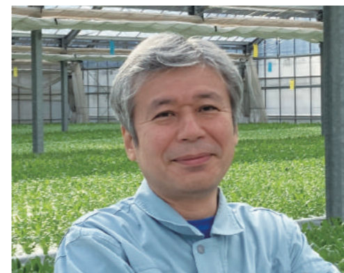
ハートランド株式会社(大阪府泉南市) 代表取締役社長